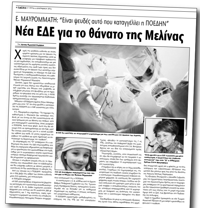
Το προχθεσινό αποκλειστικό ρεπορτάζ της "Π" που έφερε στο φως τις δημοσιότητες τη νέα ΕΞΕΛΙξη για την υπόθεση

Η ΔΥΠΕ Κρήτης ανέφερε: "Το "ψεύτικο" και "έωλο" κατηγορητήριο εναντίον της νοσηλεύτριας που επικαλείται στην ανακοίνωσή της η ΠΟΕΔΗΝ είναι μόνο το ένα μέρος του πορίσματος. Ευθύνες αποδίδονται και στους άλλους δύο εμπλεκόμενους γιατρούς. Προφανώς βολεύει αυτό να