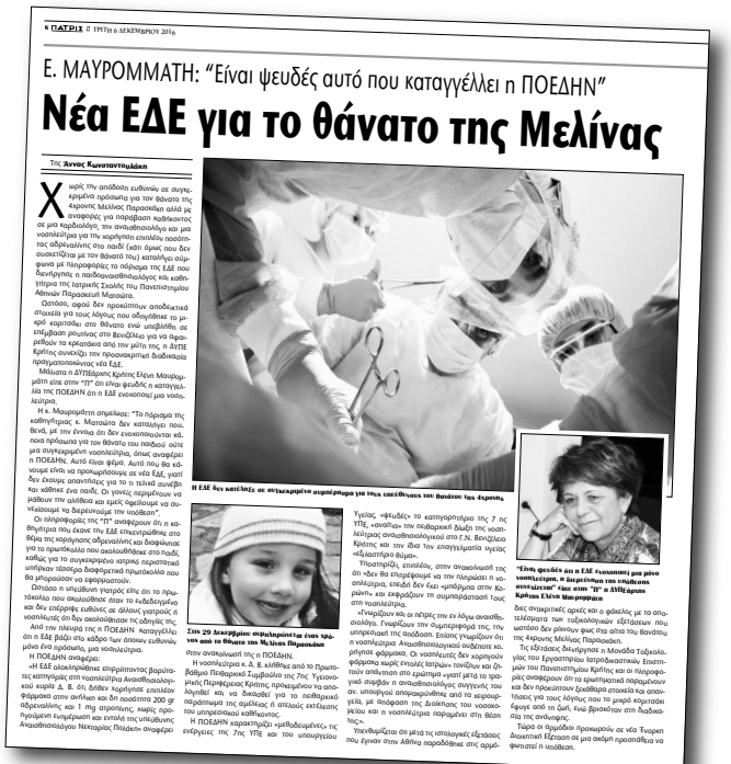
Το προχθεσινό αποκλειστικό ρεπορτάζ της "Π" που έφερε στο φως τις δημοσιότητες τη νέα ΕΞΕΛΙξη για την υπόθεση

Η ΔΥΠΕ Κρήτης ανέφερε: "Το "ψεύτικο" και "έωλο" κατηγορητήριο εναντίον της νοσηλεύτριας που επικαλείται στην ανακοίνωσή της η ΠΟΕΔΗΝ είναι μόνο το ένα μέρος του πορίσματος. Ευθύνες αποδίδονται και στους άλλους δύο εμπλεκόμενους γιατρούς. Προφανώς βολεύει αυτό να